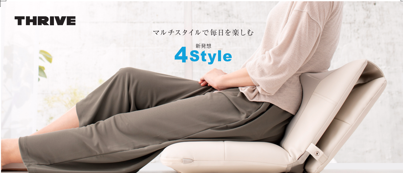
マルチマッサージチェア CMD-1000